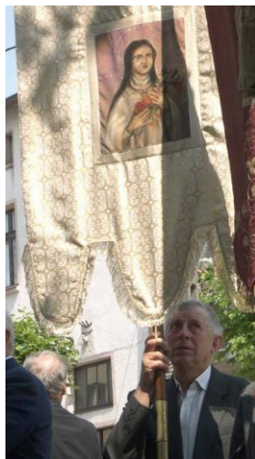
Chorągiew z wizerunkiem św. Teresy

Postać Świętej, zwanej potocznie przez mieszkańców Górzna Małą Tereską , znana była w naszym mieście już w okresie międzywojennym. Mówiono wierszyki i śpiewano piosenki. Zachowała się również broszurka o niej, wydana przez Karmelitów Bosych w Krakowie, w związku z intronizacją Najświętszego Serca Jezusowego w rodzinach.