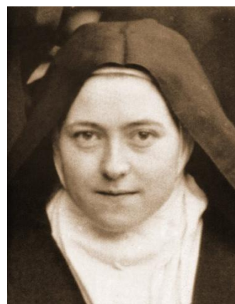
Św. Teresa od Dzieciątka Jezus, lat 23

Dnia 12 maja 2015 roku Kongregacja do spraw Kultu Bożego i Dyscypliny Sakramentów wydała dekret zatwierdzający św. Teresę od Dzieciątka Jezus Dziewicę i Doktora Kościoła Patronką u Boga miasta Górzna. Dzień 1 października jest dniem kościelnych obchodów patronalnych.